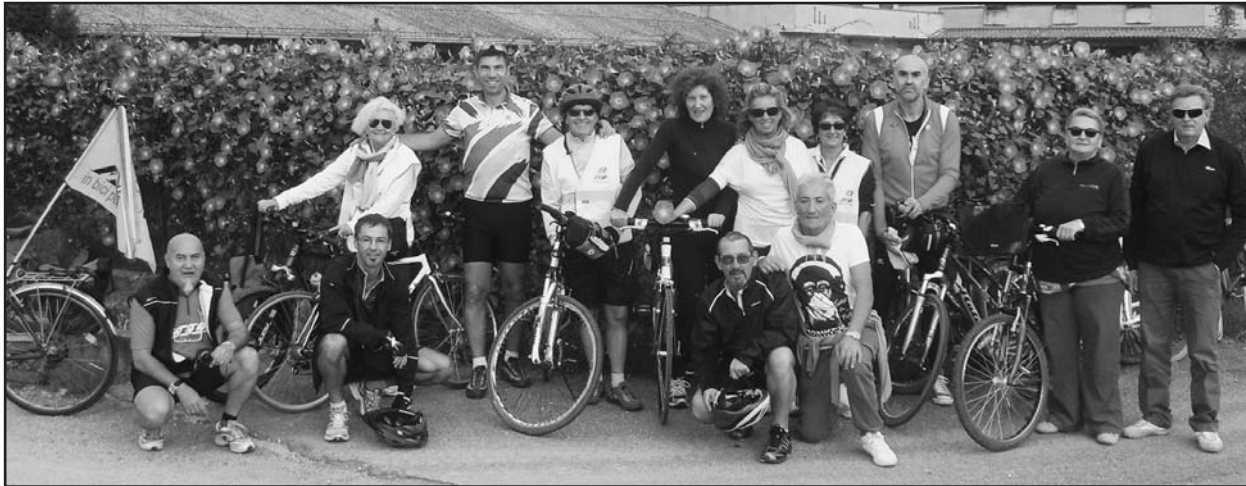
Il gruppo che ha partecipato alla gita.

“L'è prope era, a scampà s'ampara sèmpèr argot” (E' proprio vero, a vivere si impara sempre qualcosa): abbiamo preso spunto da questo detto popolare per raccontarvi la nostra gita in bicicletta con gli amici della bici di Montichiari a Botticino Mattina. Vi spieghiamo il perché. Domenica 7 ottobre la comitiva degli Amici della bici si è ritrovata per l'ultima uscita in bici, a conclusione dell'annata ciclistica 2012, come da programma. La meta era l'azienda agricola Antica Tesa di Botticino Mattina, per degustare del vino prodotto dalla famiglia Noventa, viticoltori di antica data. La nostra uscita in bici non comprendeva solo la Cantina per il buon vino che poi abbiamo po-