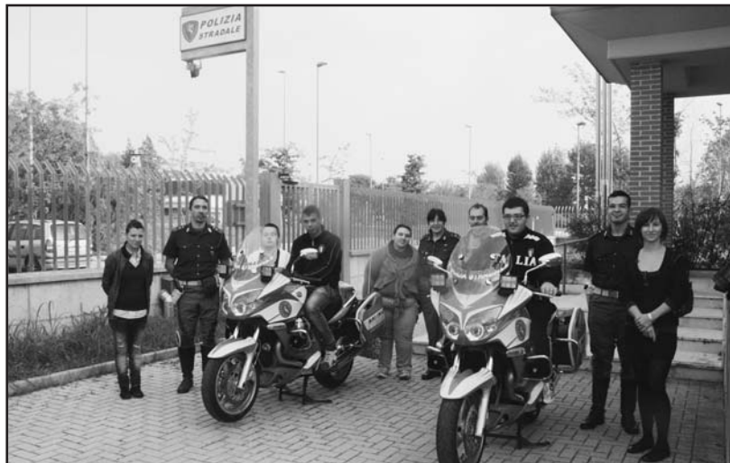
La visita dei ragazzi alla stazione di Polizia Stradale di Montichiari.

Molto interessante è stata la prova con l'etilometro che ha registrato "tutto regolare" nelle