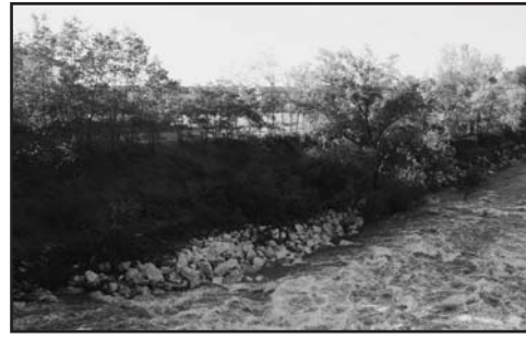
Uno scorcio del Chiese.

La mattina presto fanno compagnia gli uccelli che salutano il nuovo giorno con i loro diversi canti. I merli trotterellano davanti, quasi in un gioco: sembrano divertirsi a lasciarsi avvicinare e quando sei a pochi