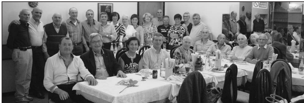
Foto ricordo alla Pizzeria Al Cervo degli ex dipendenti della Fiat Bellandi.