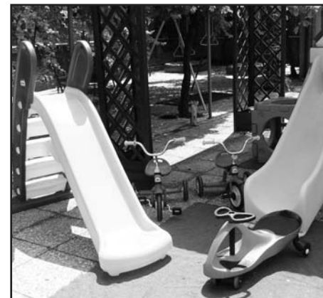
Giochi nuovi All'asilo Mafalda.

È vero dunque: la generosità, nonostante il periodo di crisi, non ha fine e noi diciamo meno male. Infatti, grazie ad un generoso contributo da parte di una azienda locale, la "Pellifal", alla scuola materna "Principessa Mafalda", si sono potuti congedare e definitivamente pensionare alcuni giochi che, ormai divenuti obsoleti, sono stati sostituiti con altri nuovi. L'acquisto di questi è stato interamente finanziato dall'imprenditore locale, così da non gravare sul bilancio della stessa fondazione.