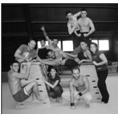
Il gruppo di Montichiari.

Dal 7 al 9 settembre infatti si è svolto un workshop di Parkour nella bellissima capitale ungherese, durante il quale i traceurs hanno avuto la possibilità di allenarsi ed esibirsi tra le vie e le piazze della città. Muri, palazzi, ringhiere ed impalcature sono diventati veri e propri attrezzi e location di allenamento per gli atleti, mentre un pubblico ignaro di ciò che stava succedendo osservava sbalordito trick ed evoluzioni aeree svolte dai ragazzi.