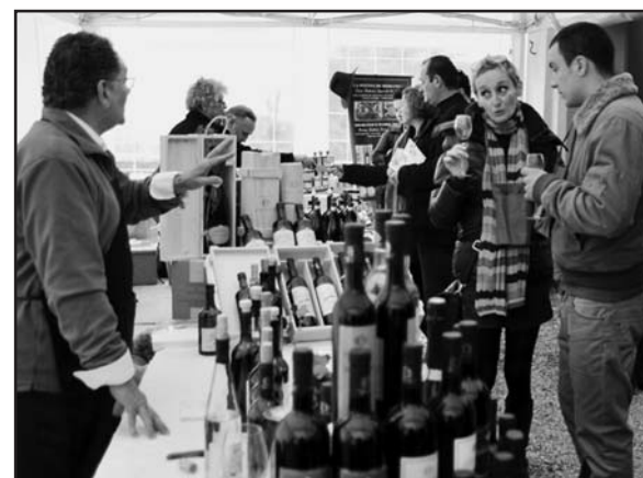
Un assaggio di vini pregiati.

ne, conserve, mostarde, marmellate, aceti, frutta e verdura di stagione. Saranno due giornate molto intense e potrete trovare tutte le informazioni su www.avolta-perstarbene.it oppure telefonando allo 0376839431.